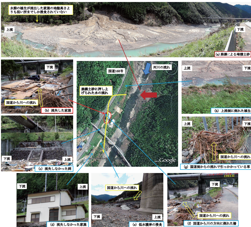
図3 十津川村野尻における被災状況

図3に十津川村野尻における被災状況の写真及び発生したと思われる現象について示す。崩壊は、9月3日の午後6時30分頃、左岸側で発生している。崩壊地のすぐ下流右岸側では、河岸沿いに建っていた2軒の家屋が流失した。本災害の主要因としては、天然ダムの形成・決壊による鉄砲水 3),4) や河川水位の上昇による洪水流 3) 等が新聞等