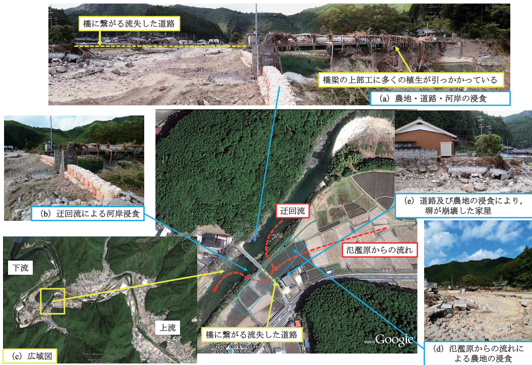
図16 熊野市五郷町における迂回流及び氾濫原からの水の流れによる河岸・道路・農地の浸食