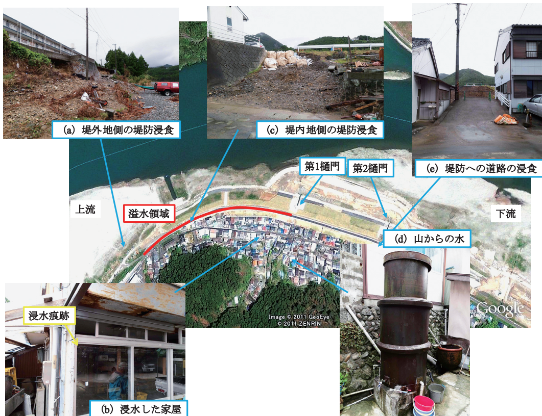
図9 新宮市相筋地区における被災状況

先導していた住民によると、第一樋門の約150m上流の堤防からは水が噴出していたとのことである。幸い、9月3日23時30分の時点では、街灯が消えておらず、地盤の低い所にいた住民は全員避難でき、死者・行方不明者は発生していない。堤防からの溢水は、住民が避難した後に発生したようであり、図9に示すように、第一樋門から上流に約150mの区間で発生したようである。この区間では、図9(a)、(c)、(e)に示すように、堤外地側だけでなく、堤内地側の堤防も浸食を受けており、堤防に上るための道の一部は流失していた(図9(e))。図10に熊野川河口の海側(あけぼの(外))と川側(あけぼの(内))、河口から約2kmに位置する成川、河口から約8kmに位置する相賀の観測所における水位の時間変化(速報値)を示す 5) 。データが示されていない点は、欠測等である。熊野川河口の外側と内側の水位を比較する