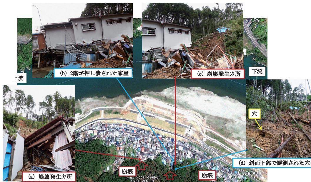
図8 新宮市相筋地区における崩壊

熊野川河口から約2.5kmの右岸側に位置する新宮市相筋地区では、内水及び外水による氾濫が発生した。9月3日の夕方の時点で既に50cm以