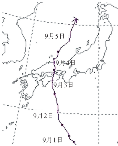
図2 台風12号の移動経路

の総降水量は、紀伊半島の広い範囲で1,000 mm を超え、奈良県上北山村にある国土交通省の雨量計では、降り始めの8月30日から9月5日までの総雨量が2,439mmとなっており、記録的な大雨となった。