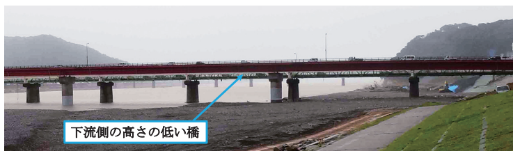
図11 熊野川下流域の道路橋

とその差は全くないことがわかる。河口砂州が良く発達することで有名な熊野川であるが、本データより、豪雨発生時には、河道内の河川水位を上昇させるような河口砂州は発生していなかったことがわかる。紀宝町総務課防災対策室によると、豪雨が発生する前の時点で、河口では、既に右岸側と左岸側に流路が形成されており、砂州は河道中央に残っているだけだったとのことである。もし、砂州が十分に発達していた場合、今回の台風のように進行速度が遅く、流量の増加率が小さい場合は、河口砂州のフラッシュが開始される流量が大きくなり、水位の高い状態が長く続くこととなる。しかし、フラッシュ開始後は、大規模に河口砂州を浸食するので、フラッシュ後の水位は非常に低くなる傾向がある。一方、平成9年7月洪水のように、比較的早く河川の流量が増加した場合は、河口砂州のフラッシュが開始される流量が小さくなるが、フラッシュ後の水位は比較的高い状態で保たれることとなる。また、新宮市相筋地