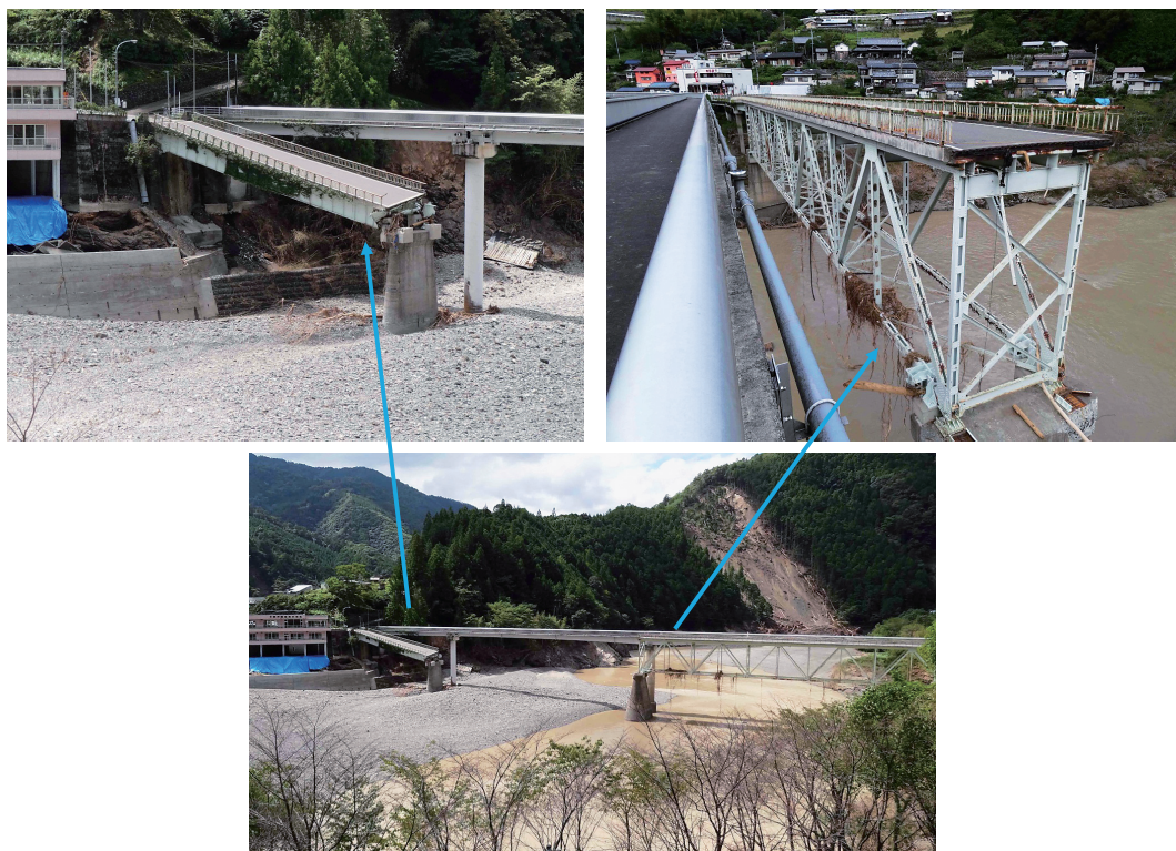
図13 落橋した折立橋

図13に落橋した折立橋を示す。折立橋は自動車用の橋と歩行者用の橋が併設されており、落橋したのは下流側に位置する自動車用の橋の右岸側である。自動車用の橋は上部工がトラス構造の橋であり、奈良県によると、トラスの部分に流木や植生などのゴミが引っかかり、落橋したとのことである。流失したトラス部分は、約200m下流まで