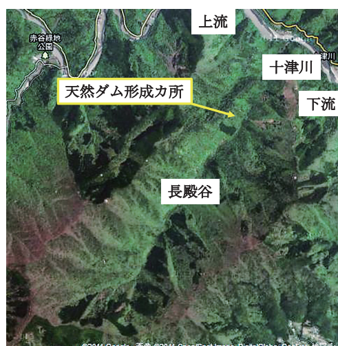
図5 天然ダムが形成された十津川村長殿谷の位置

今回の調査では、十津川村長殿の長殿谷に形成された天然ダムと十津川村宇宮原で形成・決壊したと思われる天然ダムの痕跡を調査した。図5に示すように、長殿谷は十津川右岸側の流域であ