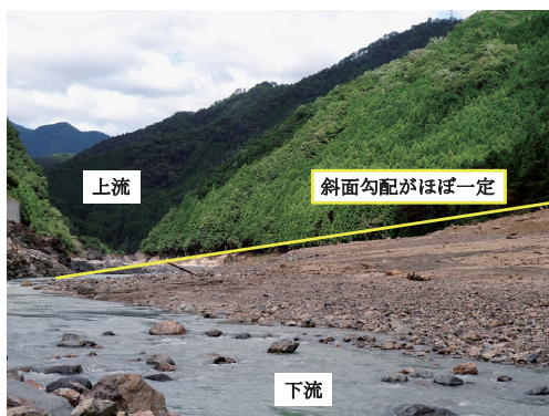
図4 十津川町野尻における被災状況

で報道されたが、崩壊した土砂の堆積形状を見る限り、天然ダムの形成・決壊は確認できなかった。これは、以下のような理由からである。まず、河道横断線に沿った形で土砂の堆積地形を見た場合、天然ダムが形成されたとすると川に近い部分で急角度となることが多い(例えば、後述する図7(a),(c))。これは、天然ダムが決壊するときに、貯まった水による浸食によって、堆積した土砂が削り取られて、横断勾配が急になるためである。しかし、野尻の堆積地形の横断形状は、図4に示すように直線的であり、貯まった水による堆積土砂の浸食現象は確認できなかった。また、天然ダムが形成・破壊が発生した場合、崩壊土砂の堆積範囲より上流域では、下流域よりも高いところまで水際の植生が剥ぎ取られることが多い(例えば、後述する図7(a))。これは、天然ダムにより堰上げされた水が、天然ダム決壊時に大きな掃流力で水が流出するためである。しかし、野尻地区の崩壊地では、図3(a)に示すように、崩壊土砂の堆積範囲の上流では低いところまでしか水際の植生が削り取られていない。これらの事より、野尻においては、2件の家屋を流失させるような規模の天然ダムは形成されていなかったと考えられる。また、河川水位上昇による洪水流も家屋の流失の原因としては考えにくい。これは、流出した家屋が2軒のみであり、流出した家屋から約30m下流で地盤高さも低い所に位置する祠(図3(c))や流出した家屋から約80m下流の家屋(図3(d))に外的損傷がほとんど無いため、全体的に水位が