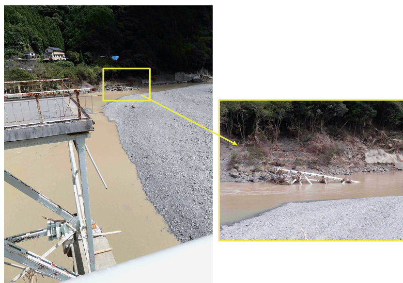
図14 流失した折立橋のトラス部分

浸食のプロセスは、以下のように考えられる。つまり、(1)谷が狭い場所の橋に多くの植生が引っかけり、水が上流の氾濫原に広く貯留された、(2)橋によって堰上げされた水が橋を迂回して橋の下流に流れ込んだ、(3)迂回して下流河道に流れ込む流れが急勾配で河道に流れ込み、橋梁下流の左岸側の護岸(河岸)を崩壊させた、(4)橋梁下流の左岸側の護岸の崩壊により、氾濫原に広く貯留されていた水が崩壊した護岸の方向に流れ込んだ、(5)その結果、橋に続く道路が浸食さ