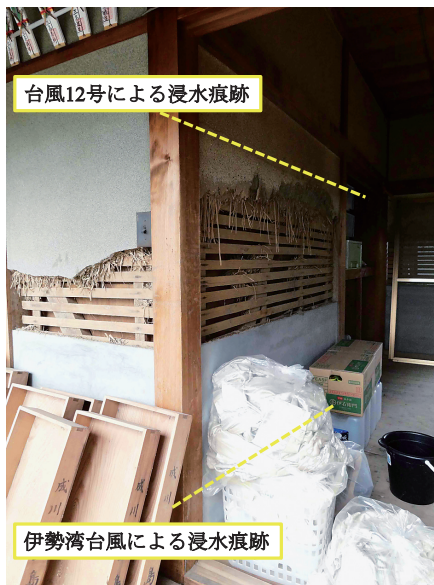
図12 紀宝町で浸水した家屋

新宮川河口から約1.5km上流左岸側では、溢水により外水氾濫が発生した。住民によると、JR紀勢本線付近を撮影していたビデオカメラにより、9月4日午前2時頃に溢水したことを確認したとのことである。図12に示すように、浸水深は約2mであり、住民によると伊勢湾台風の時の浸水深よりも1m以上高かったとのことである。