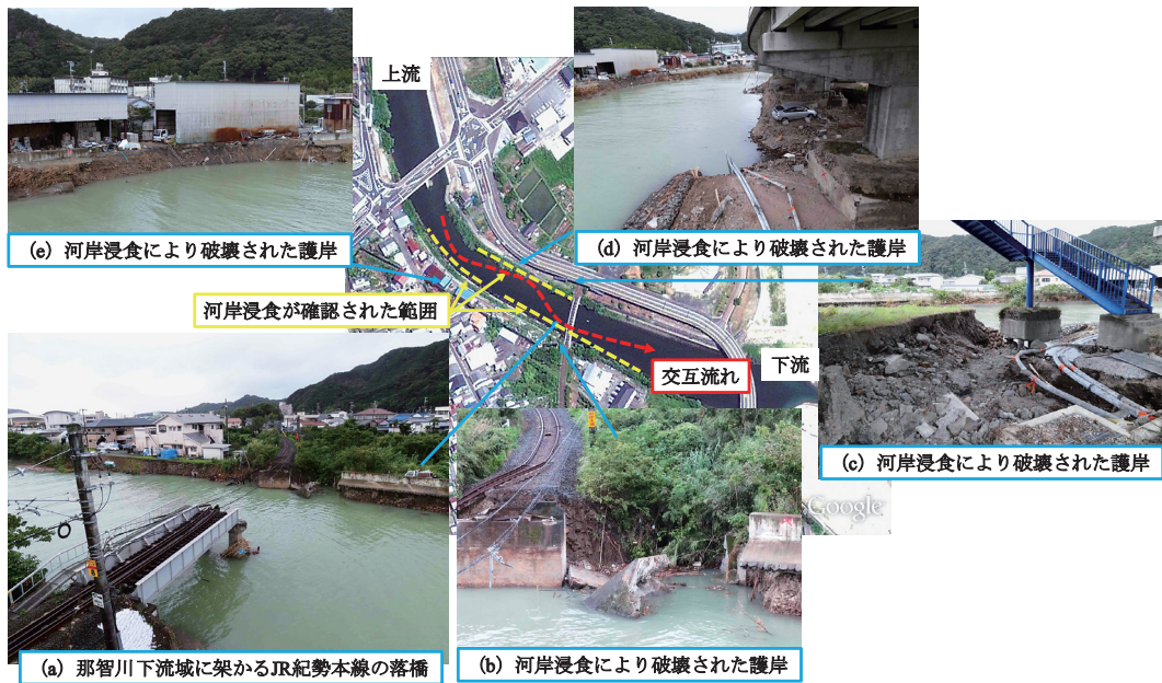
図15 那智川下流に架かる JR 紀勢本線の橋周辺の被災状況