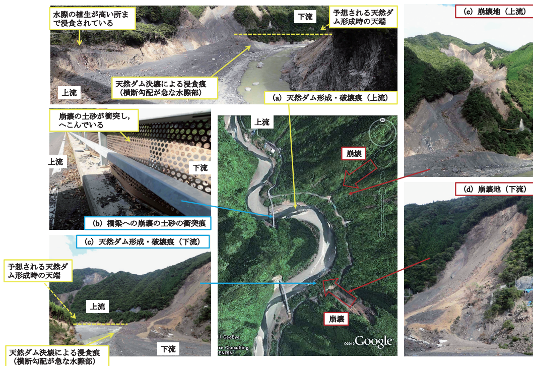
図7 十津川村宇宮原における天然ダムの形成・破壊痕

十津川村宇宮原では、200m程度しか離れていない2カ所で天然ダムの形成・破壊が確認された。図7(a)と(e)に上流側の崩壊地及び天然ダムの形成・破壊痕、図7(c)と(d)に下流側の地すべり崩壊地及び天然ダムの形成・破壊痕を示す。形成されたと予想される天然ダムの高さは、天然ダム形成時の土砂の堆積痕(図7(a)と(c))や河岸の植生の浸食高さ(図7(a))から、上流側の方が高かったようである。このように、天然ダム