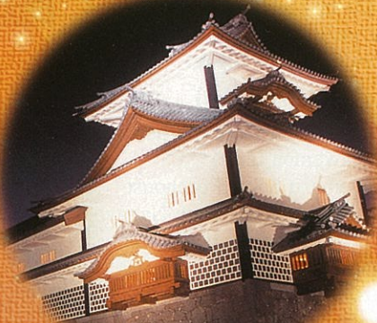
菱櫓・五十間長屋・橋爪門続櫓

なお、外周の石垣等の ライトアップは毎日、日没から 午後10時まで開催 【ライトアップ施設】 外周の石垣、石川門、鶴丸倉庫 菱櫓・五十間長屋 橋爪門続櫓 河北門、鼠多門、鼠多門橋