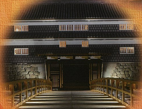
鼠多門・鼠多門橋