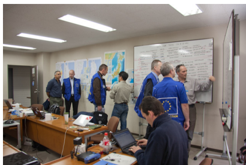
写真1 OSOCCを訪問したチームに対するブリーフィング

本部と連携をとることが過去にもあったが、今回は活動現場が近い国際搜索救助チーム同士が自主的にsub-OSOCCを立ち上げ、OSOCCとの連携を図った。大船渡では米国・フェアファックスチームが、仙台ではロシアのチームがsub-OSOCCを主導し、適宜OSOCCに情報を提供した 5 。また、先のニュージーランド南島地震では、ニュージーランドはUNDACを要請せず自らOSOCCを運営し、国際搜索救助チームの調整を行った。このことは、これらのチームがINSARAGやUNDAC等の調整メカニズムに精通しているからこそ可能となったものである。